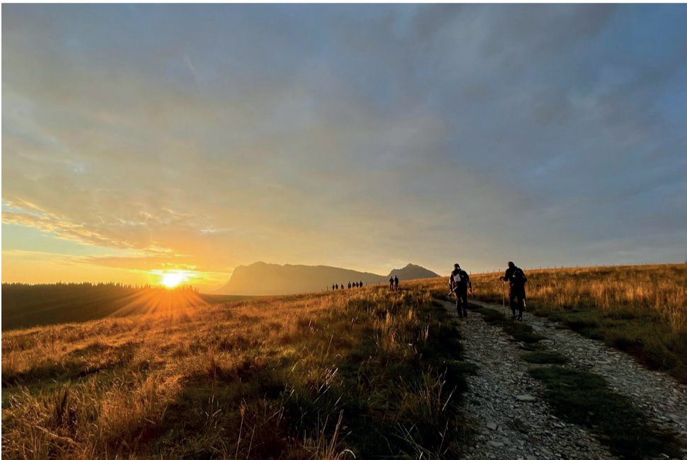
Les marcheurs au lever du soleil au Niremont

Charlotte, surnommée la petite coccinelle, a été emportée par la maladie en 2020. Elle a laissé en exemple sa volonté constante d'aider et de penser aux autres. Dans cet esprit, la Marche a perduré.