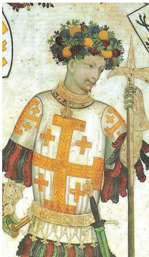
Un célèbre chevalier : Godefroy de Bouillon © Wikipédia

Pour commencer, démêlons les comtes de Savoie et les comtes de Genève. La seigneurie de Rue était vassale des Comtes de Genève. Par la suite, une querelle s'est invitée entre ces comtes qui étaient en fait cousins avec les comtes de Savoie. À l'issue de cette guéguerre familiale, la Seigneurie de Rue a été donnée par les comtes de Genève aux comtes de Savoie jusqu'en 1536. C'est à cette date que nous intégrons le canton de Fribourg, créé en 1481 lors de la diète de Stans où Nicolas de Flüe (devenu Saint) a servi de médiateur.