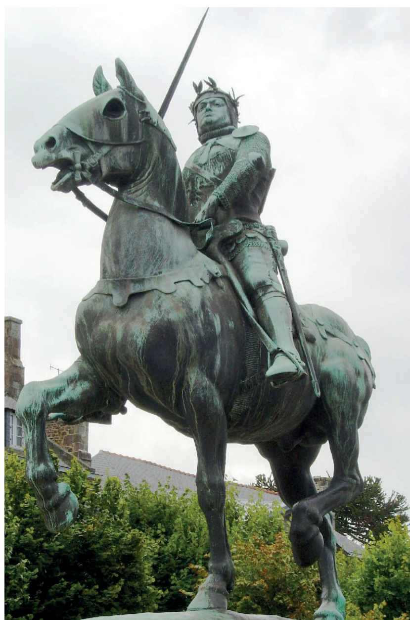
Autre célébrité chevaleresque : Bertrand du Guesclin, sur l'indispensable accessoire équestre

Dans les prochains épisodes, en ce début de grande fusion communale depuis le 1er janvier 2025, nous allons rester en l'an mil, pour évoquer la naissance et l'histoire des villages de notre nouvelle commune