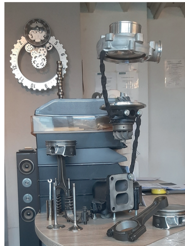
« Trophées » de chasse et outils pédagogiques