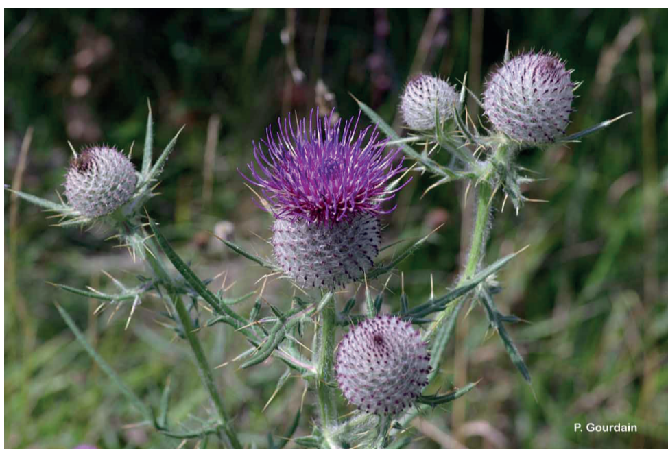
Le cirse laineux

Le chardon, souvent perçu comme une mauvaise herbe envahissante, est pourtant un symbole ancré dans l'histoire et la culture écossaise. Emblème national depuis le XVe siècle, il aurait alerté les Écossais d'une attaque nocturne norvégienne par les cris des assaillants piqués par ses épines. Malgré son importance historique, il demeure une plante envahissante qui nécessite une gestion rigoureuse dans les jardins et les champs.