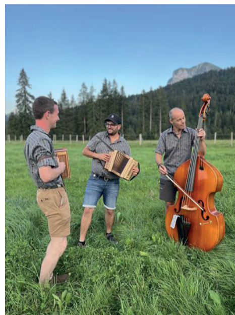
Le trio Gentiane

Les épreuves sont très particulières, elles répondent au calibre spécifique du tir en campagne : les participants ont 18 cartouches, à tirer en trois sessions distinctes : d'abord 6 coups, au coup par coup, en 6 minutes. Ensuite, il y a le 2 x 3 coups, un feu de vitesse en 60 secondes. L'épreuve finale est le 6 coups, un feu de vitesse en 60 secondes. Dans tous les cas, il s'agit de tirs commandés : un commissaire donne l'ordre de tir et proclame le cessez-le-feu.