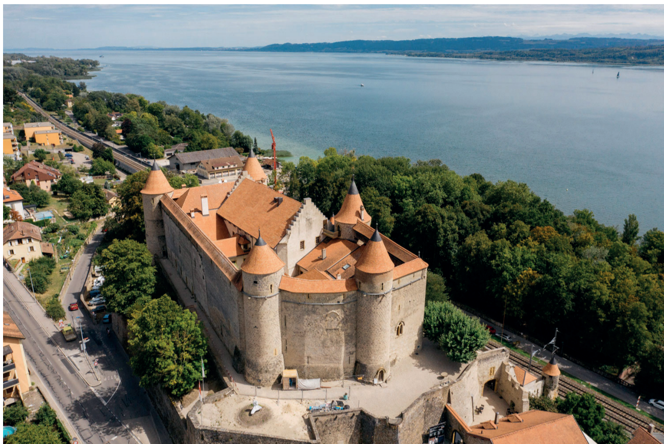
Mentionné pour la première fois aux alentours de 1050, le château de Grandson est une imposante forteresse gothique

La faiblesse des rois (d'où le qualificatif « roitelets ») n'était qu'un aspect de ce que l'on commençait à appeler Novae res , les « choses naturelles » qualifiées de révolution féodale. L'élan pour la construction de fortifications partout où cela était possible est dénommé, de nos jours, l'incastellamento. Cette obsession qui menait à tout fortifier, après la peur de fin du monde de l'an mil, allait au-delà de la simple crainte de l'agression. Elle était révélatrice d'une terre sans Seigneur ou Roi. D'abord faits de bois, les châteaux furent construits en pierre. Ils dominaient les buttes et les éperons rocheux et en changeait le paysage. Établis en postes avancés, les châteaux devinrent le symbole d'une occupation militaire. Pour la rendre effective, les nobles autoproclamés (personnes ayant de la richesse et des terres), durent compter sur des individus armés montés à cheval qui