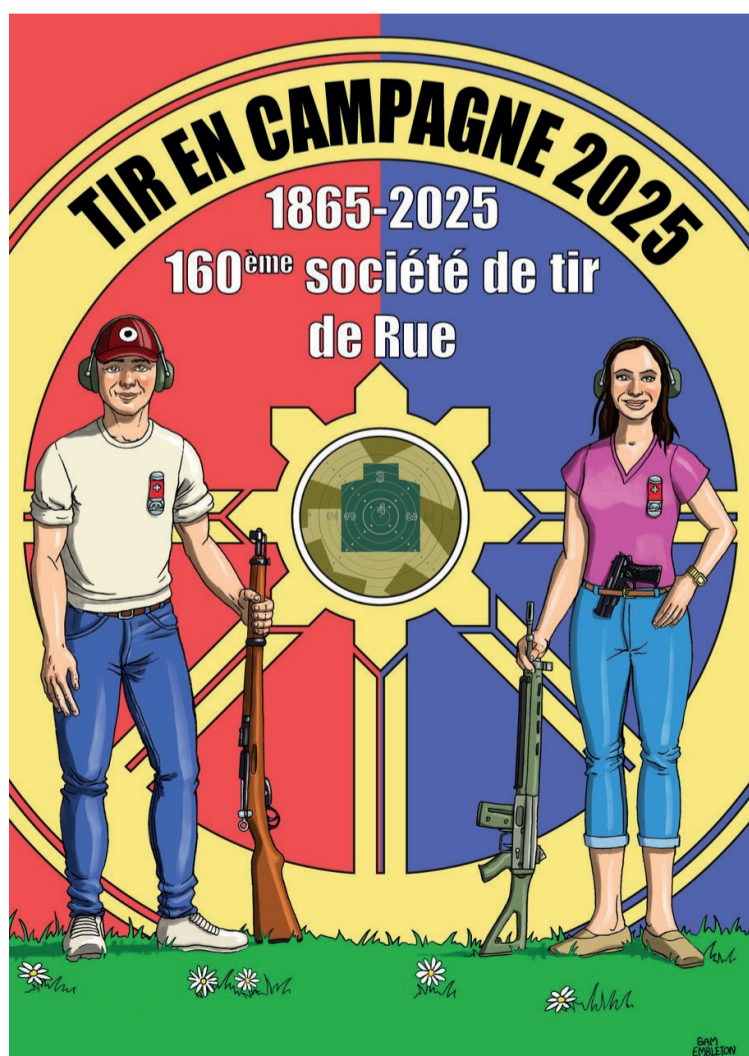
L'affiche de la manifestation dessinée par Sam Embleton