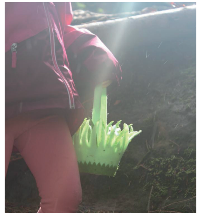
5 œufs par enfant : les petits paniers sont bien utiles