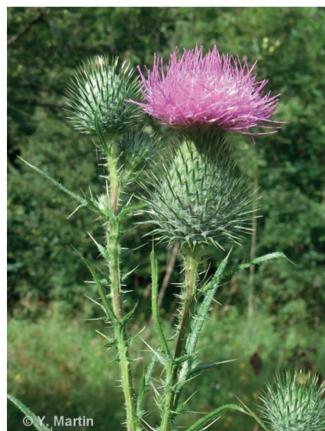
Le cirse vulgaire