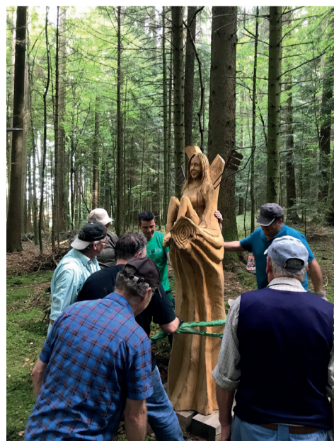
Ho ! Hisse ! La dame ne sait pas encore utiliser ses ailes