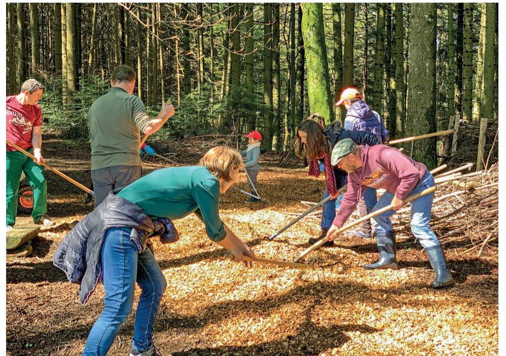
L'union fait la force et entretient la bonne humeur.