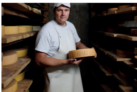
La tomme de Lavaux fabriquée à la ferme familiale

Un nouveau chapitre s'ouvre le 1er janvier 2024, avec la reprise de la laiterie d'Ecoteaux. L'occasion d'avoir à nouveau un bel outil de production couplé à un espace de vente. Outre le Gruyère AOP, pas moins de 18 sortes de yoghourts sont concoctées sur place. Tous sans lactose : cela permet d'ajouter moins de sucre et tout le monde peut en manger. Un fromage à la grecque fait aussi partie de l'assortiment. Pour s'initier, Benedikt a fait un stage en Bulgarie, avec un fromager grec. Ils ne parlaient pas la même langue, mais les gestes professionnels sont manifestement universels. Pour les amateurs de fondues aux saveurs particulières, ou pour ceux qui ont simplement envie de diversité dans le caquelon, il existe un mélange de fondue fumée. La tomme de Lavaux bio, produite par les repreneurs de la ferme familiale à Puidoux, est toujours sur les étals. Ce fromage de montagne se déguste très bien en raclette.