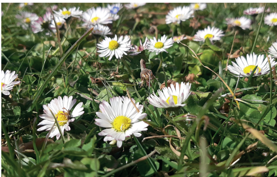
De belles choses se cachent juste sous nos pieds

C'est un autre moyen de transport qui vous attend en page Histoire: embarquez dans la machine à remonter le temps, à la découverte du passé du village de Gillarens. Et si vous avez envie de vous évader encore plus loin, cap sur notre feuilleton, au pays de l'imagination.