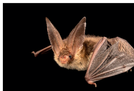
Oreillard roux

Bref, leur survie dépend en grande partie de nos choix d'aménagement. C'est un peu notre responsabilité.