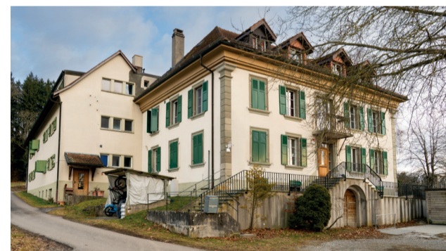
Foyer Saint Jean Bosco

Un manoir néoclassique construit par Nicolas Pache, entre 1829 et 1834, est sur deux niveaux sous combles en pavillon. Une très belle chapelle a été érigée à l'intérieur de cet orphelinat, légué en 1869 par son fils Pierre à l'orphelinat Saint Jean Bosco d'Auboranges, en même temps que l'hospice de Billens. Le foyer est dirigé par les Sœurs ursulines.