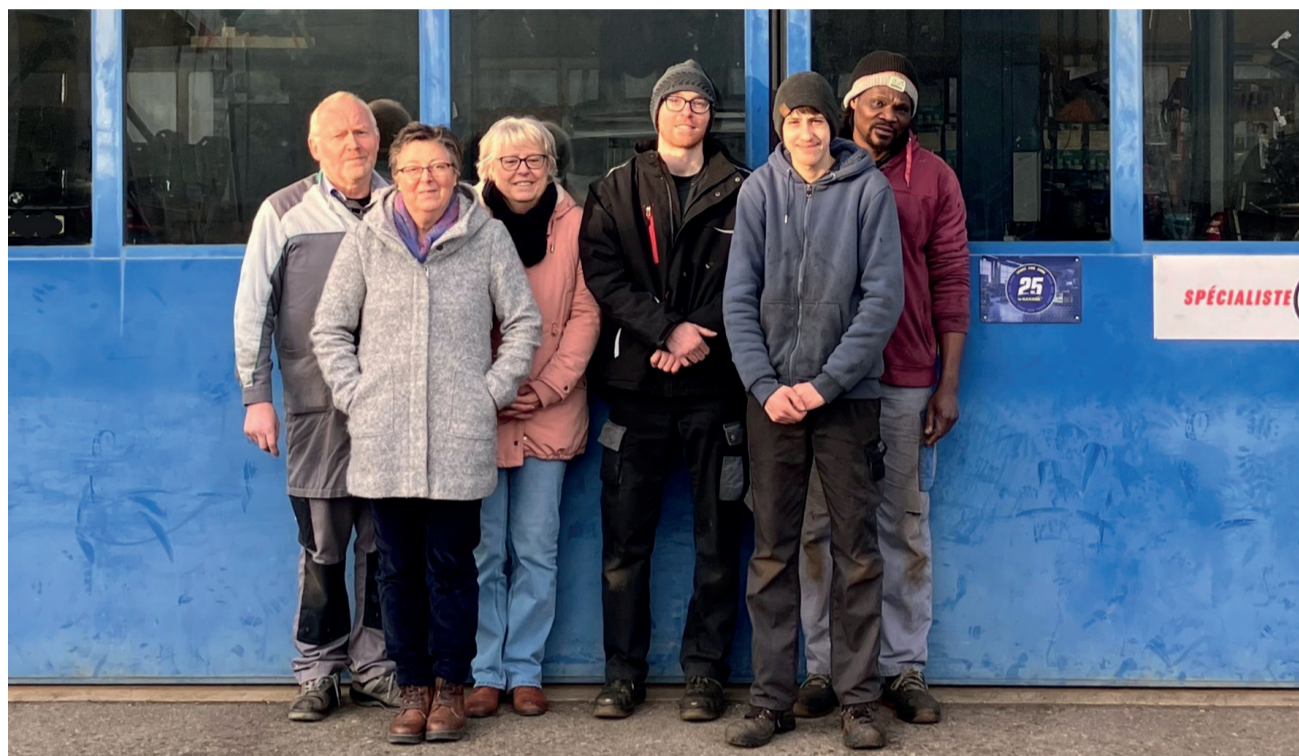
Un jeune patron (4e depuis la gauche) bien entouré