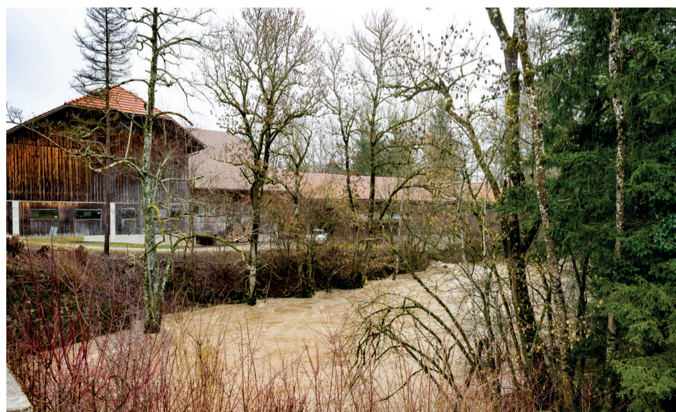
Le moulin de Coppet