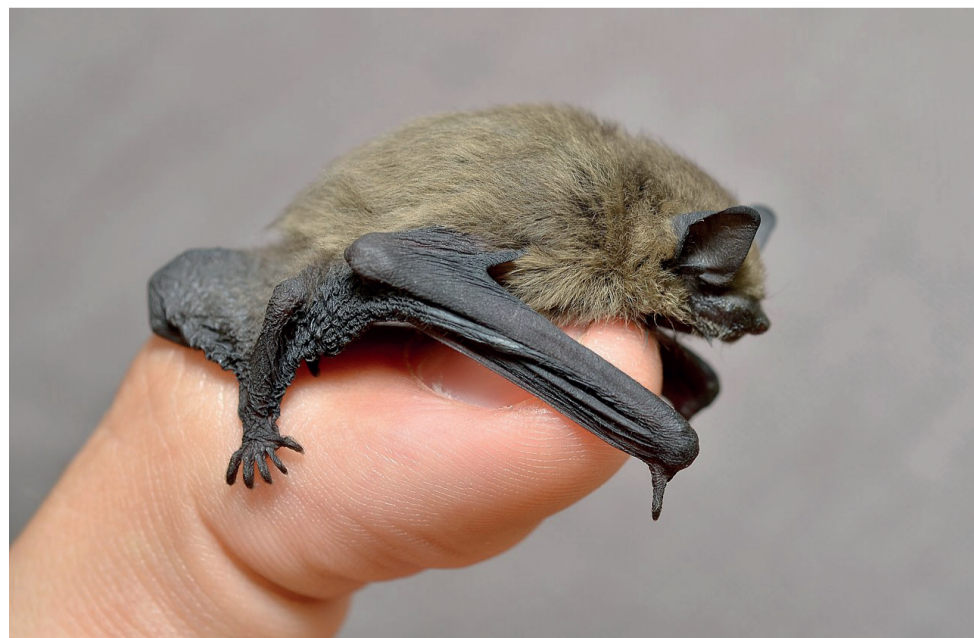
Pipistrelle commune