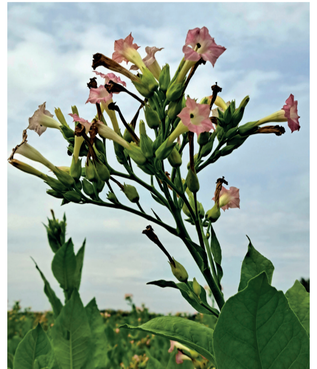
Plant de tabac en fleurs

■ Cinquième étape : dépendre et effeuiller. Si toutes les étapes précédentes se sont bien passées, il restera aux planteurs un dernier travail. Une fois