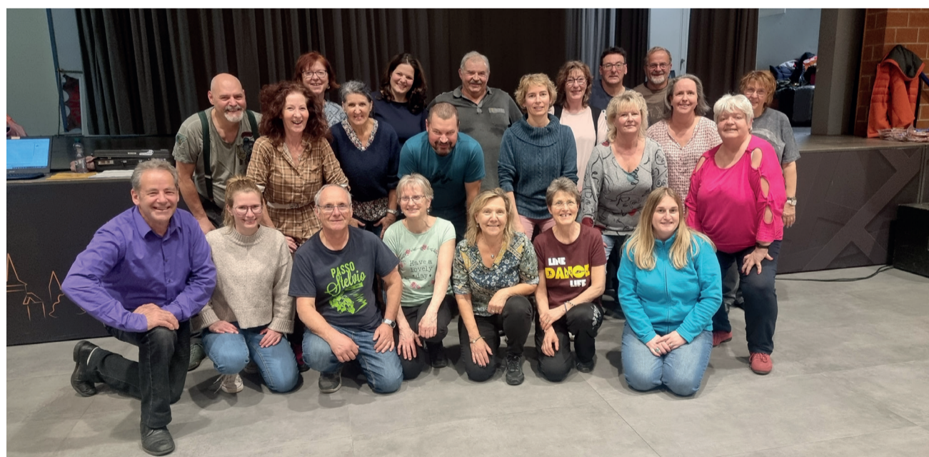
Le groupe des danseurs du lundi

les cours étaient en suisse allemand avec un niveau d'exigence élevé, heureusement qu'une de nous pouvait traduire. C'était une sacrée victoire d'avoir tous réussi avec brio. »