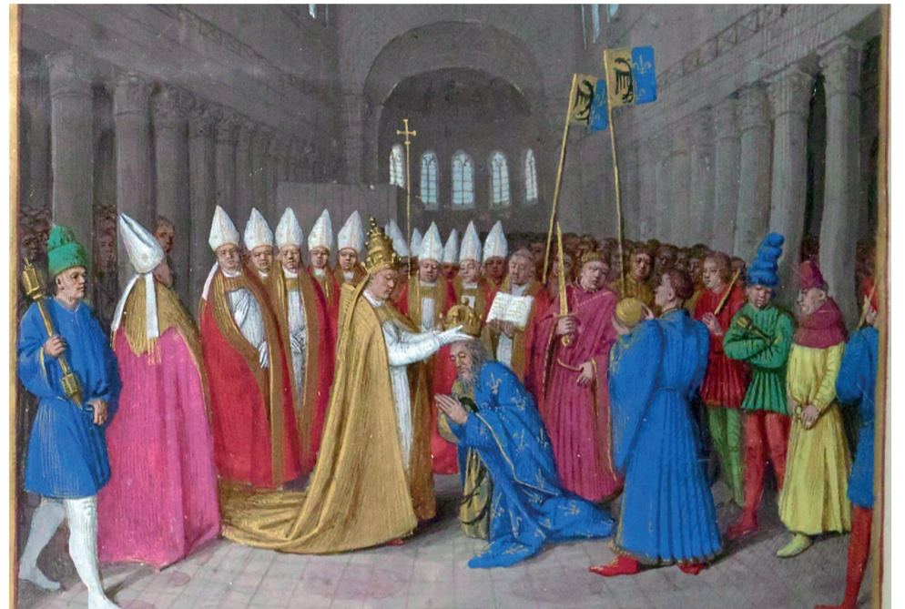
Jean Fouquet de Touur - Sacre de Charlemagne - enluminure

Charlemagne meurt le 28 janvier 814 d'une pneumonie à Aix-la-Chapelle et sera canonisé en 1165 par l'anti-pape Pascal III, sur demande de l'empereur Frédéric 1er Barberousse. Son Empire Carolingien ne lui survivra pas