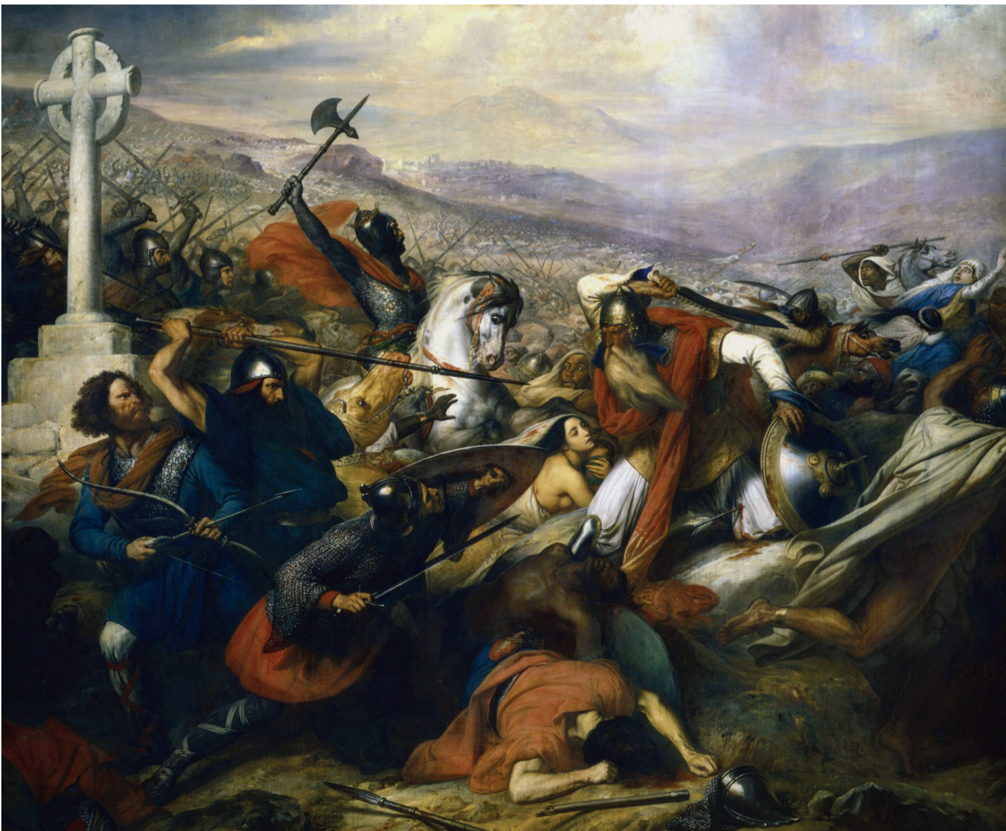
Charles de Steuben - Bataille de Poitiers en 732 - huile sur canevas