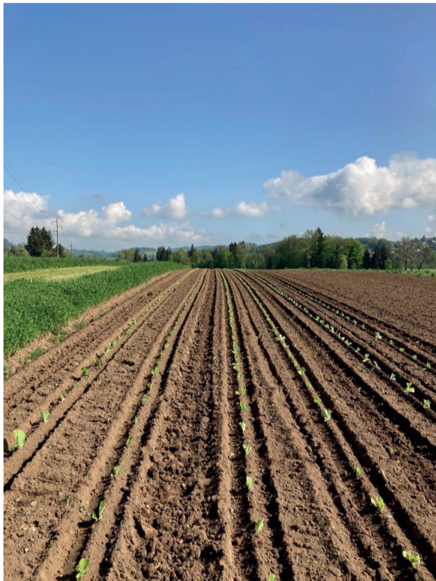
Les plantons de tabac tout juste mis en terre

Un soupçon d'histoire, une touche de médecine et un échange riche en enseignements.