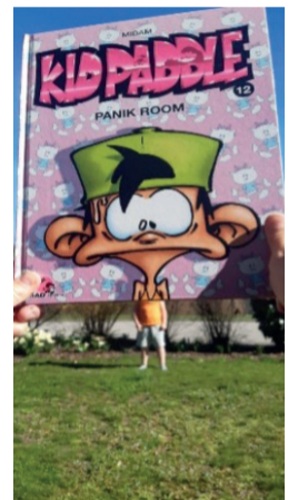
Exemples de bookface