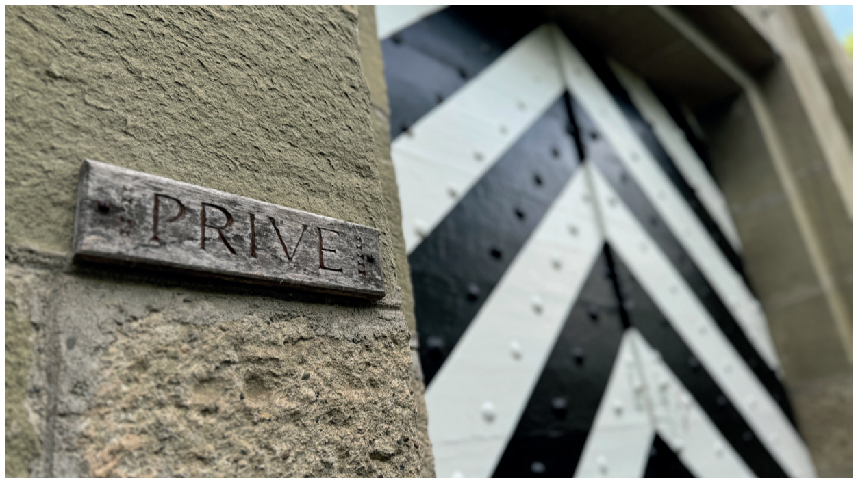
Les portes du donjon s'ouvriront grâce à votre smartphone