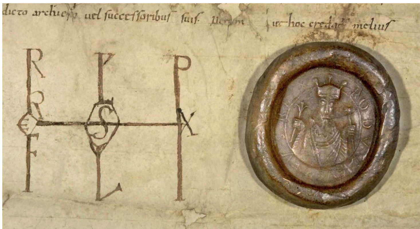
Empreinte de cire et monogramme de Rodolphe III © Archives départementales de Savoie (extrait SA 176)

Les Comtes de Genevois et le comté de Genève disparaissent à la suite de son achat, en 1401, par le voisin, qui se trouve être le comte Amédée VIII de Savoie. Il devient à partir de 1416 un apanage savoyard, soit la partie du domaine royal accordée à un prince qui renonçait au pouvoir.