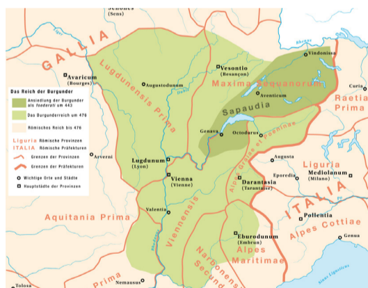
Le territoire de la Sapaudie

Bien plus tard, vers -4'000 av. J.-C., le grand peuple des Celtes, lui, venu du nord et composé de plusieurs tribus, se rend vers le sud de l'Europe. Deux de ces tribus, les Helvètes et les Burgondes, s'installent en -400 av. J.-C sur un plateau nommé la Sapaudie (du latin Sapaudia qui signifie « forêt de sapins »), région comprise entre le Jura et les Alpes, soit la plus grande partie du plateau suisse actuel, incluant les cités de Genève, Nyon et Avenches (VD). Pour la petite histoire, cette région se situait dans le territoire actuel de la Savoie (le nom de Sapaudia donnera ensuite les noms des départements Savoie et