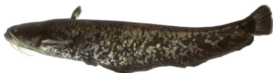
Le Silure Glane

Commençons cette épopée à l'inter-glaciation, soit vers l'an -11'000 av. J.-C. C'est le début de la sédentarisation pour les humains qui vivent dans nos contrées. Les eaux se sont retirées de notre région et ont laissé derrière elles dans nos rivières un gros poisson : le silure « glane », qu'on trouve encore en abondance dans les lacs et les rivières d'Europe. De là à dire que la région a donné son nom à ce poisson, il n'y a qu'un pas... qu'on ne franchira pas. De cette époque, nous retrouverons également, beaucoup plus tard, en 2020 lors de travaux de terrassement à la sortie de Rue en direction d'Ursy (travaux pour la nouvelle zone artisanale d'Ursy), des blocs erratiques de plusieurs tonnes et mesurant plus de 2 mètres.