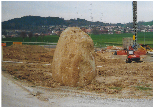
Blocs erratiques trouvés lors de travaux de terrassement

Avançons de quelques millénaires et arrêtons-nous maintenant vers l'an -6'000 av. J.-C. Le Sahara est, à cette époque, très fertile. La faune y est riche et des peuples divers de chasseurs cueilleurs y sont installés. Au fil des siècles, la désertification progresse, les lacs s'assèchent et le Sahara devient tel que nous le connaissons actuellement. Les populations qui y habitent migrent vers l'est et le nord de l'Europe où d'immenses forêts couvrent tout le territoire.