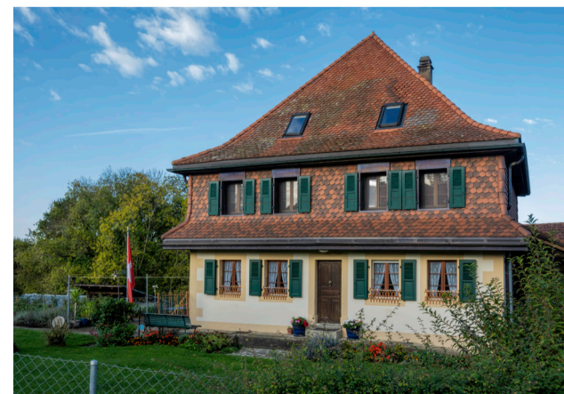
Château Collon à Gillarens - Toit de style Mansart

Texte : Roger Perriard et Virginie Barrelet