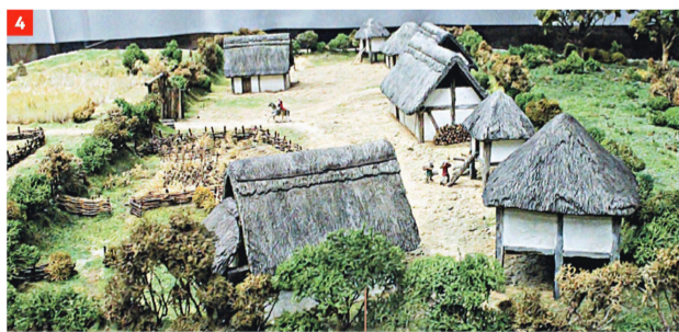
© Livre d'histoire du Plan d'études romand «Des Helvètes celtes au Helvètes Gallo-Romains»

L'éperon rocheux de Rue devient alors un site stratégique important. Le Castrum Rota est un bourg construit en retrait de l'éperon rocheux, la forme arrondie de son plateau favorisant la construction d'un camp retranché, avec des troncs et des madriers en palissades. Le village d'habitations est également intégré dans ce camp. Celui-ci subira plusieurs destructions et pillages : les attaques de brigands et de peuples peu amicaux qui traversent l'Helvétie sont incessantes. Avec l'arrivée des Romains, un premier bâti, une tour en pierre, est construite pour protéger le hameau : voici la naissance du donjon du Château de Rue. Les résidents préfèrent quitter le camp retranché pour s'installer au flanc de l'éperon. Les habitations construites au pied du rocher, d'abord en bois et en toits de chaume, se parent ensuite de tuiles en bois (tavillons), puis en pierre (ardoise).