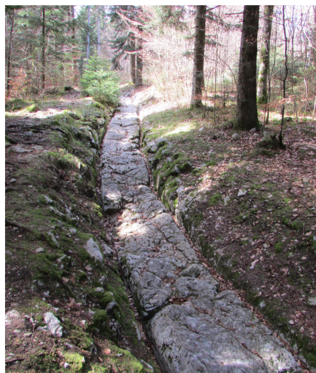
Ballaigues, voie romaine

puis Blessens (par le Gros Essert), et Porsel en direction de la Gruyère. A l'emplacement du Gros Essert, les romains érigent une tour fortifiée avec des dépendances, dont il ne reste malheureusement aucun vestige aujourd'hui, les ruines du bâtiment ayant servi à la construction de l'école de Blessens en 1913.