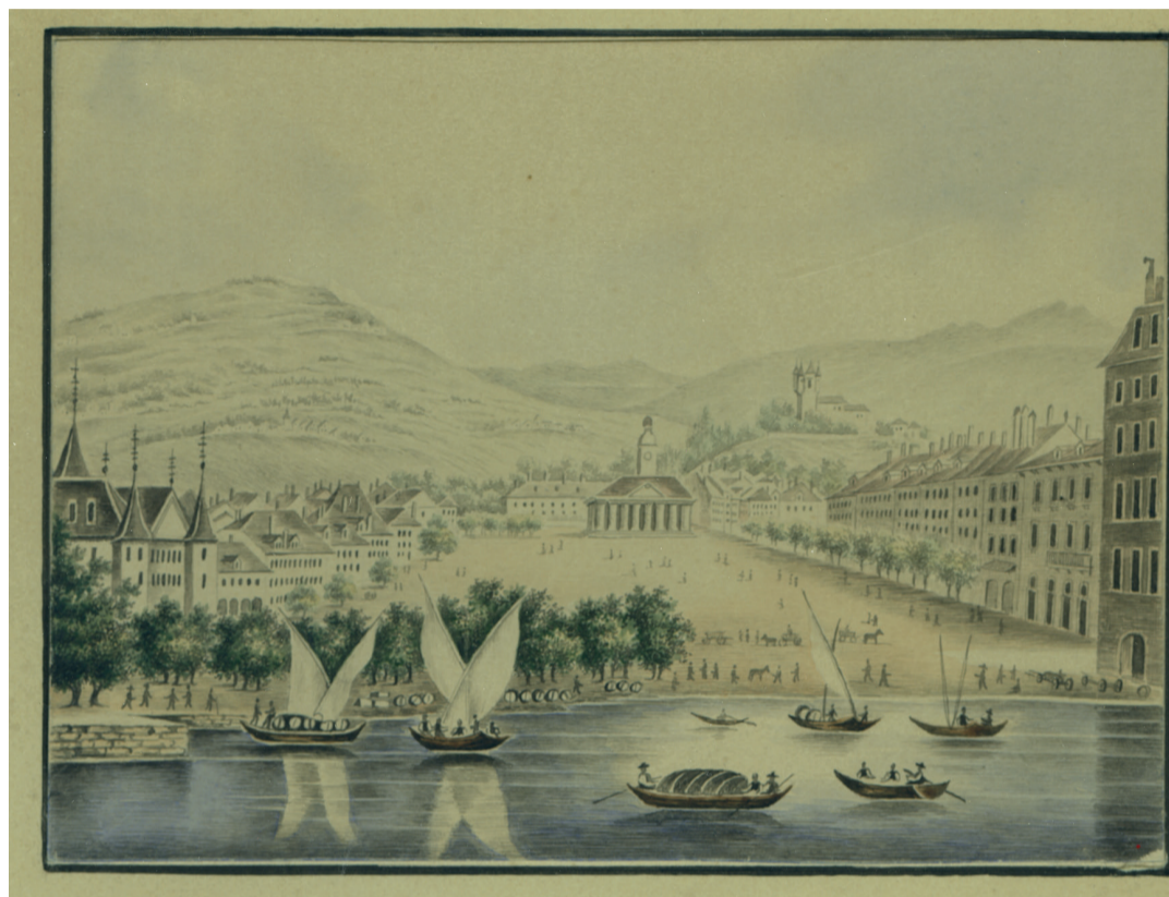
Port de Vevey © Aquarelle anonyme

Au XIII siècle, le camp fortifié sur la route romaine « Castrum Rota » est estampillé ville par la Comtesse Isabelle de Chalon, veuve de Louis II de Savoie. Castrum Rota reçoit alors le droit de prélever un péage, des franchises et des coutumes, ainsi que des dîmes pour toutes les marchandises et chars transitant via la route romaine en provenance d'Italie par le Grand-Saint-Bernard, en passant par Vevey, Jongny, Lausanne, et traversant Promasens, Rue, Moudon et se déployant jusqu'en Haute Broye. La ville est forti-