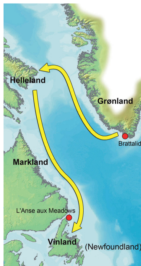
Le trajet qu'aurait fait Leif Erikson

Quittons un instant notre région turbulente pour suivre un explorateur islandais issu du royaume Viking du nord de l'Europe. Il s'agit de Leif Erikson, né vers 970 en Islande et probablement mort autour de 1020 au Groenland. Leif