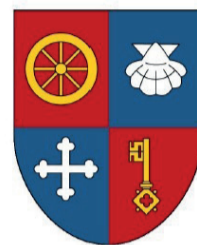
Armoiries de la nouvelle commune

Le montant de l'aide financière octroyée par l'Etat s'élève à Fr. 586'800.-. Elle sera versée à partir du 1er janvier 2026.