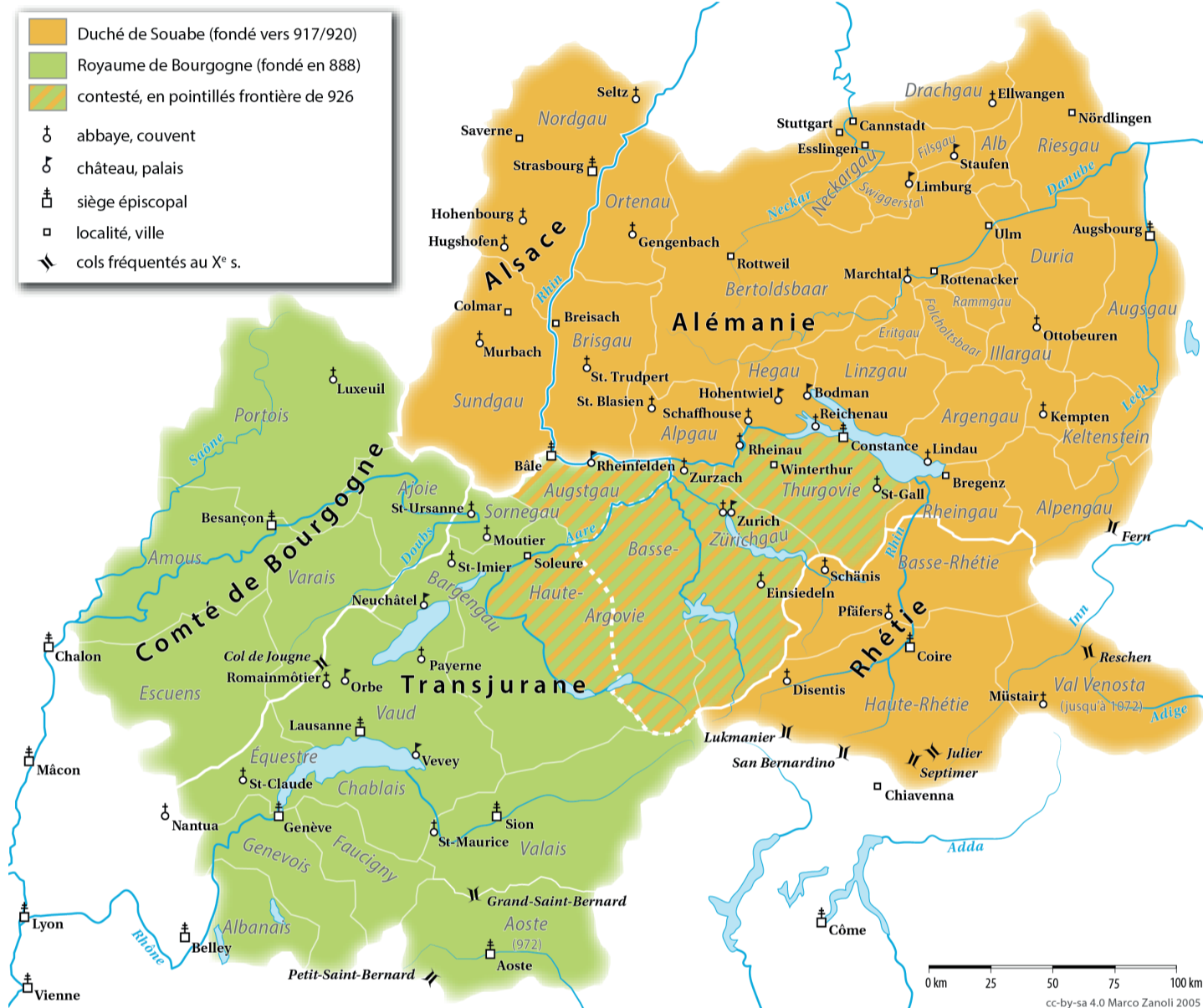
Souabe et Haute-Bourgogne © Marco Zanoli