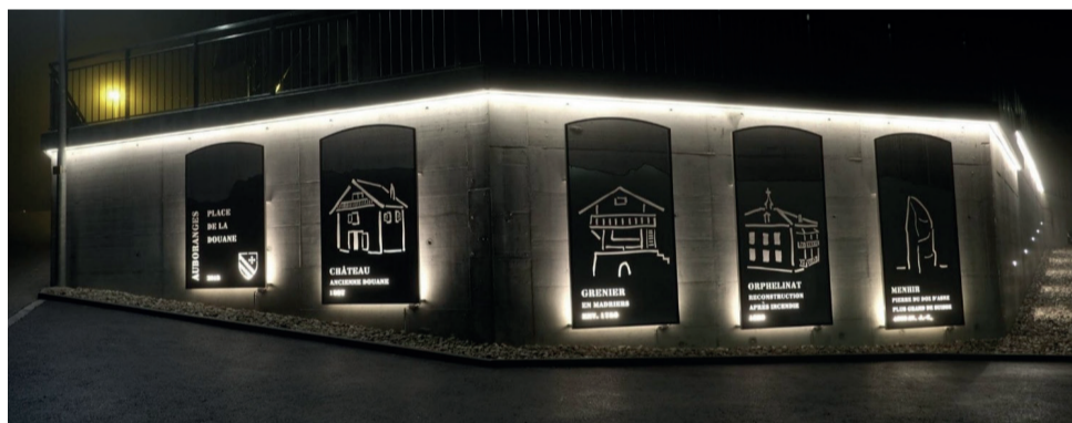
Auboranges by night: wonderful!