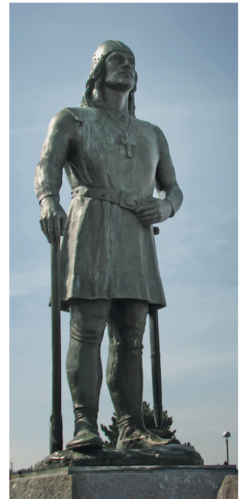
Statue de Leif Erikson à Seattle

était un des trois fils d'Erik le Rouge. Il partit en longeant les côtes nord de la Norvège pour arriver au Groenland vers le détroit de Béring, puis descendit les côtes de l'Amérique du Nord, jusqu'aux alentours de ce qu'on identifierait comme New York aujourd'hui. Il établit une colonie appelée Vinland et revint dans sa patrie. Lors du périple Viking en Amérique du Nord, le frère de Leif, Thorvald, rencontra des tribus amérindiennes, déclenchant hostilités et tueries – avec les Micmacs, Hurons, Iroquois, etc. Les mots du vocabulaire gallois que l'on peut trouver aujourd'hui dans les langages de ces tribus peuvent en attester. Leif Erikson aurait donc découvert l'Amérique 500 ans avant Christophe Colomb. Ce n'est que plus tard que les Vikings déferleront sur l'Europe.